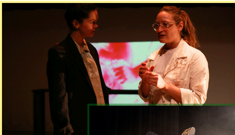
DES FILLES SAGES

Cela nous a donné l'opportunité de consolider notre ancrage en Île-de-France, notamment grâce au travail d'action culturelle que nous menons depuis plusieurs années et que nous avons prolongé autour de Lisière : CREAC avec le Théâtre Dunois sur les saisons 23-24 et 24-25, CREAC et CAC avec le Centre Culturel Jean Houdremont - La Courneuve, interventions en classes et ateliers. La transmission est en effet au cœur de notre pratique et des missions du collectif. Nous avons tissé des partenariats pérennes avec plusieurs structures, notamment La Cave à Théâtre à Colombes et le Théâtre des Quartiers d'Ivry, dans le cadre du prix Adel Hakim des lycéens.